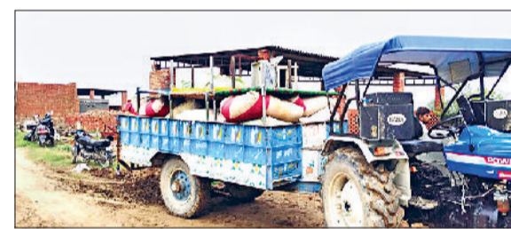
सिरसा। दाणियों से पलायन करते ग्रामीण।

गांव मोडिया खेड़ा और गुडिया खेड़ा के बीच हिसार घग्गर ड्रेन के टूटने के दूसरे दिन भी बांधने का कार्य जारी है। दरार को बांधने के साथ कमजोर तटबंधों मजबूत करने का काम लगातार जारी है। ग्रामीण कस्सी, बठल और जेसीबी मशीनों की मदद से मिट्टी डालकर और बेग भरकर दरार को भरने की कोशिश कर रहे हैं। वहीं लकड़ी की जालियां लगाकर और रस्सियों से बांधकर पानी की तेज धार को रोका जा रहा है। ग्रामीण दिन-रात मेहनत कर रहे हैं, लेकिन अब तक