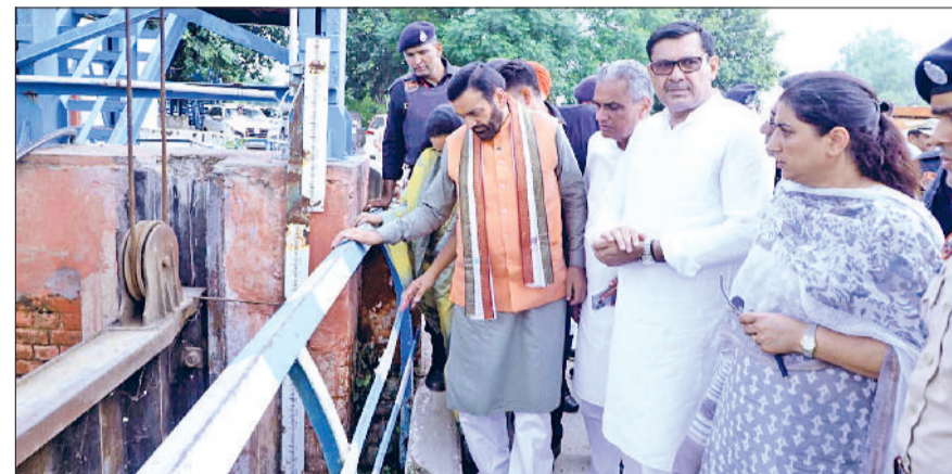
फतेहाबाद। बलियाला हेड का निरीक्षण करते सीएम नायब सिंह सैनी।

मुख्यमंत्री नायब सिंह सैनी ने कहा कि प्रदेश में इस बार भारी बरसात के कारण सभी तरह की व्यवस्थाएं अव्यवस्थाओं में बदल गई हैं। प्राकृतिक आपदा का हम सबको मिलकर सामना करना होगा। लोग धैर्य रखें, प्रदेश सरकार पूरी तरह उनके साथ खड़ी है। किसानों को हुए नुकसान को भरपाई की जाएगी। सीएम नायब सिंह सैनी ने रविवार को फतेहाबाद जिले के टोहाना क्षेत्र में बलियाला हेड और जाखल के चांदपुरा साइफन का निरीक्षण कर प्रबंधों का जायजा लिया और अधिकारियों को आवश्यक निर्देश भी दिए। पत्रकारों से बातचीत करते हुए सीएम नायब सिंह सैनी ने कहा कि प्रदेश में भारी बारिश और बाद के कारण लो लाइन परिचाय में जलभराव हुआ है। फतेहाबाद, टोहाना, हिसार, हांसी में