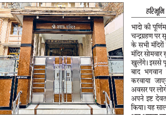
फतेहाबाद। बंद पड़े श्री श्याम मंदिर के कपाट।

यह साल का अंतिम चन्द्रग्रहण, अब अगला 31 मार्च 2028 को लगेगा