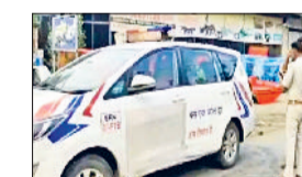
रतिया। महिलाओं को थाने ले जाते पुलिस की टीम।

शहर के सरदूलगढ़ रोड पर एक स्क्रेप स्टोर के मालिक ने आज उसकी दुकान से चोरी करते हुए 6 महिलाओं को रंगे हाथों पकड़ लिया इसकी सूचना पुलिस को दे दी। इसके बाद पुलिस की टीम मौके पर