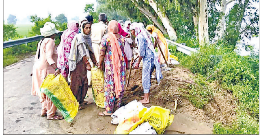
जिला प्रशासन और सिंचाई विभाग की टीमों हर समय अलर्ट

ग्रामीणों की परेशानी को बढ़ा दिया और तटबंधों को मजबूत करने में लगे कार्य में भी बाधा डाली। जिला प्रशासन घग्गर नदी के जलस्तर और तटबंधों की सुरक्षा को लेकर पूरी सतर्कता बरत रहा है। सिंचाई विभाग की 24 टीमों सेक्टर वाइज निरंतर निगरानी कर रही हैं। घग्गर के तटबंधों को और मजबूत करने के लिए मिट्टी के कट्टे लगाए जा रहे हैं, साथ ही जेसीबी और पोकलेंन मशीनों की मदद से तटबंधों की मजबूती सुनिश्चित की जा रही है। बारिश के बावजूद टीमों लगातार व्यवस्थाओं को सुदृढ़ करने में जुटी हैं। ये टीमों ग्रामीणों के साथ लगातार संवाद बनाए हुए हैं और बिजली व्यवस्था सहित अन्य आवश्यक संसाधन उपलब्ध करवा रही हैं। इसके अलावा एसडीएम, तहसीलदार व अन्य मौजूद रहे।