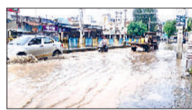
सिरसा। बरसात के बाद सड़कों पर हुए गहरे गड्ढे तथा सड़कों पर जलभराव से गुजरते वाहन।