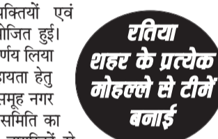
रतिया शहर के प्रत्येक मोहल्ले से टीम बनाई